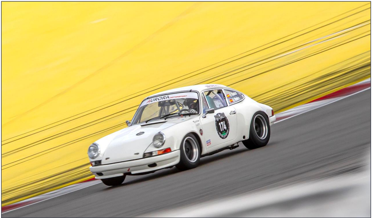
Nuestro incombustible Antonio Castro, esta vez acompañado por Nuñez, con su bonito Porsche 911ST