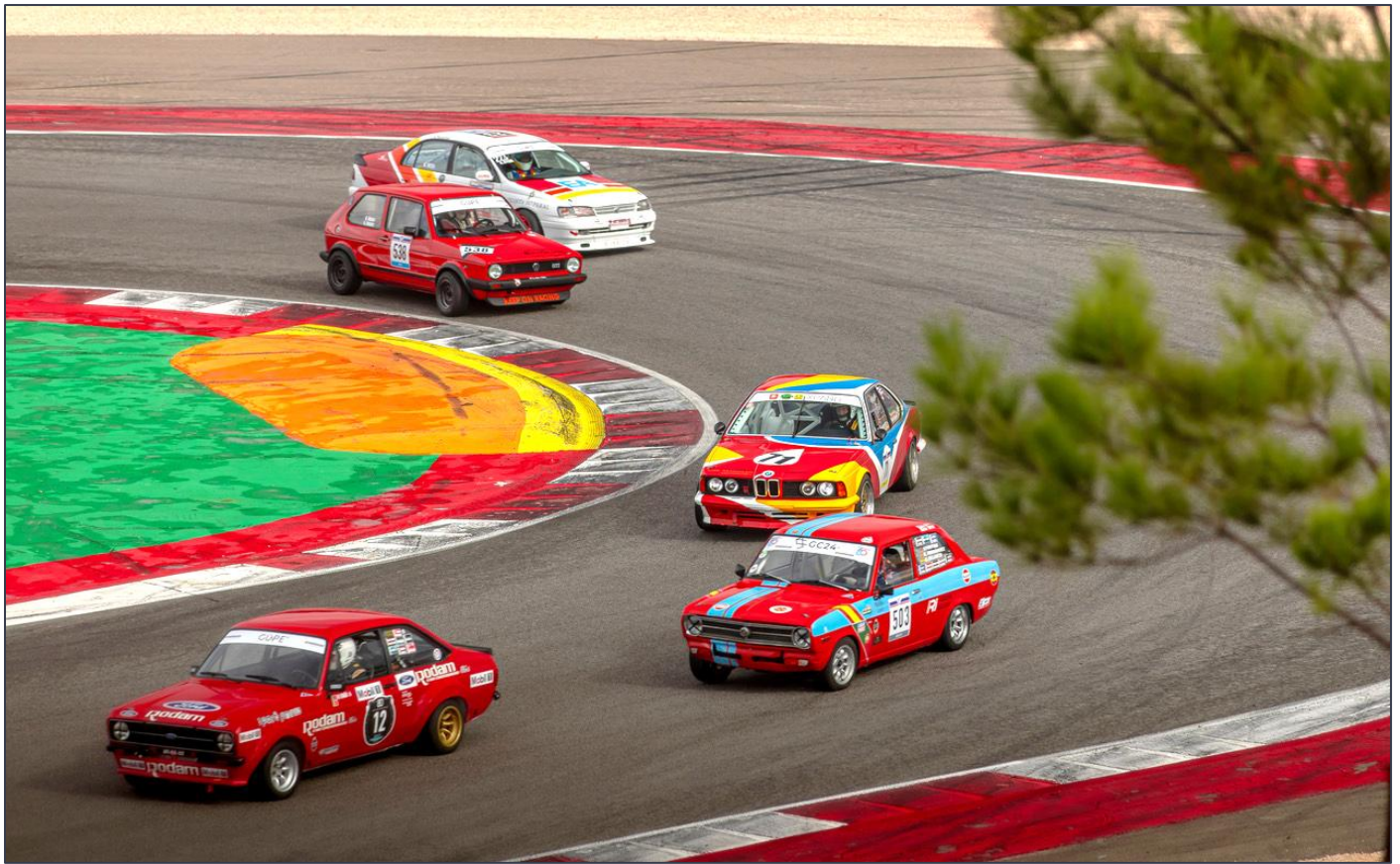
Colorido en la Carrera 80