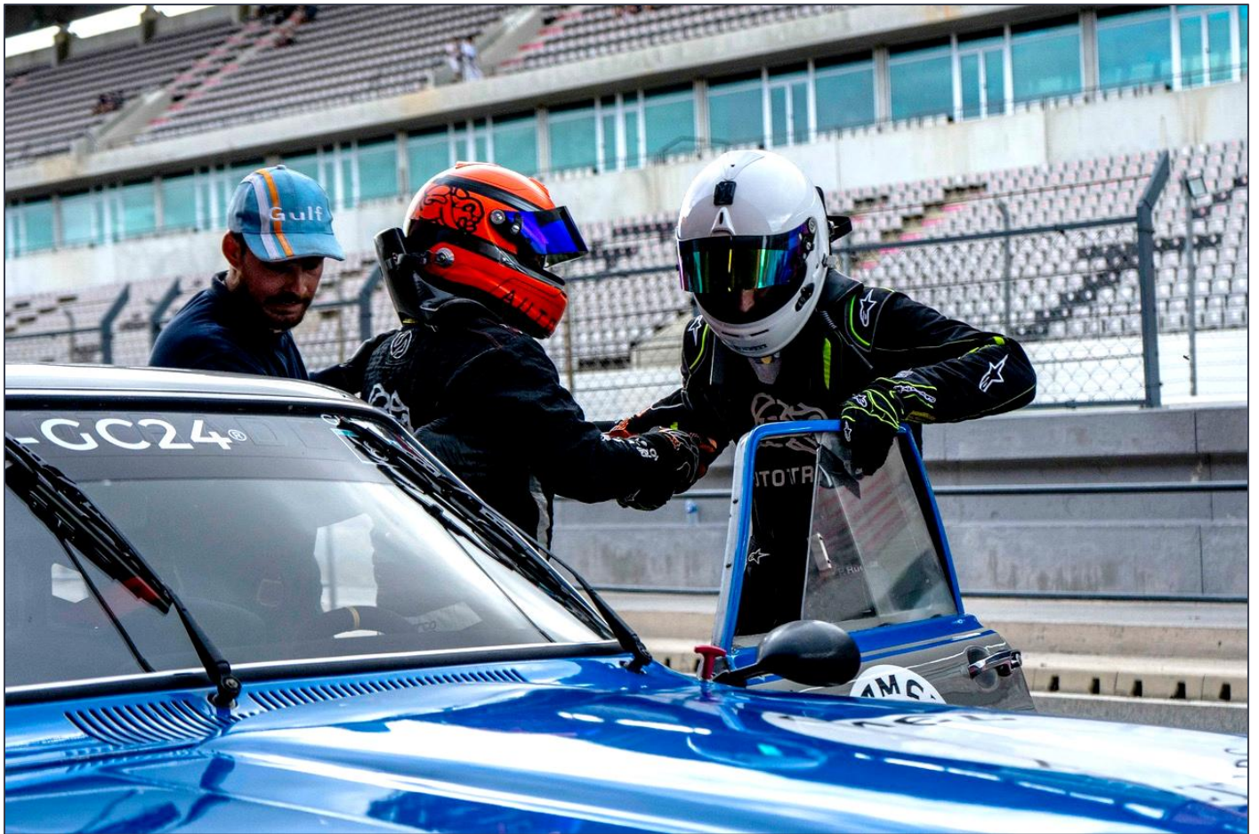
Cambio de pilotos, en el Ford Capri de los Rueda