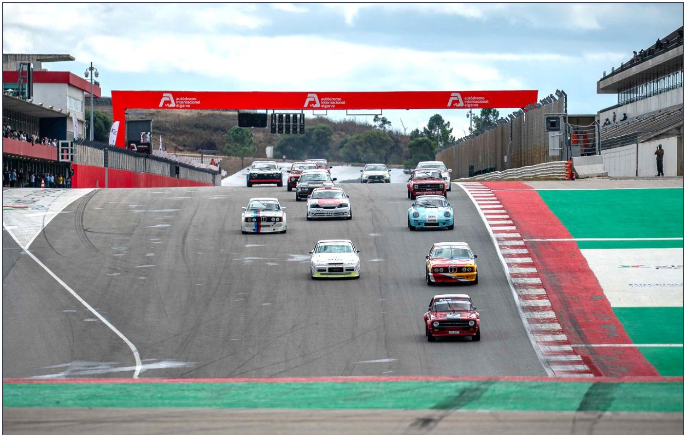
Salida de una de las carreras, en el “tobogán” de Portimão