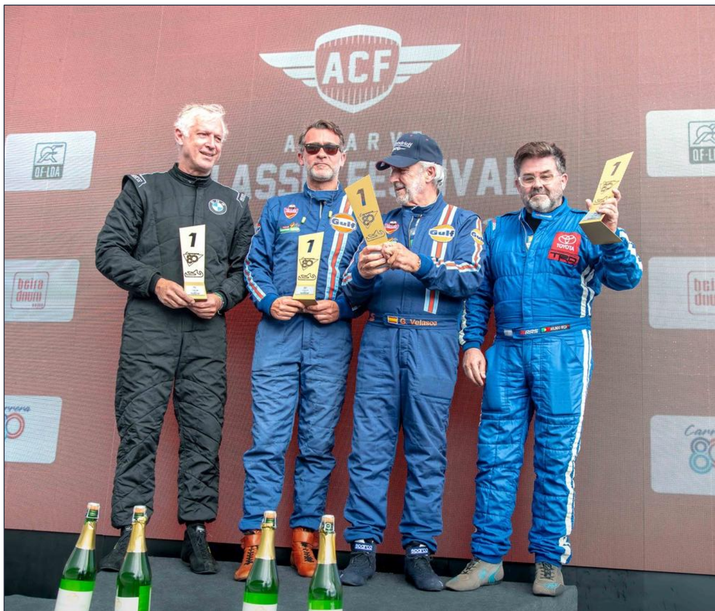
Podio de los primeros clasificados de cada Categoría