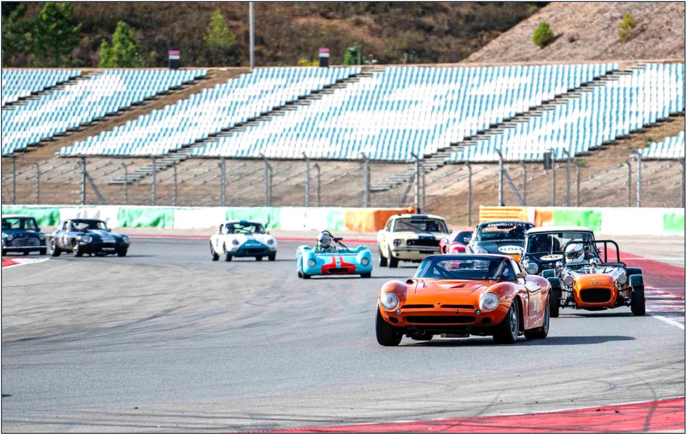
Impresionante la diversidad y calidad de los coches