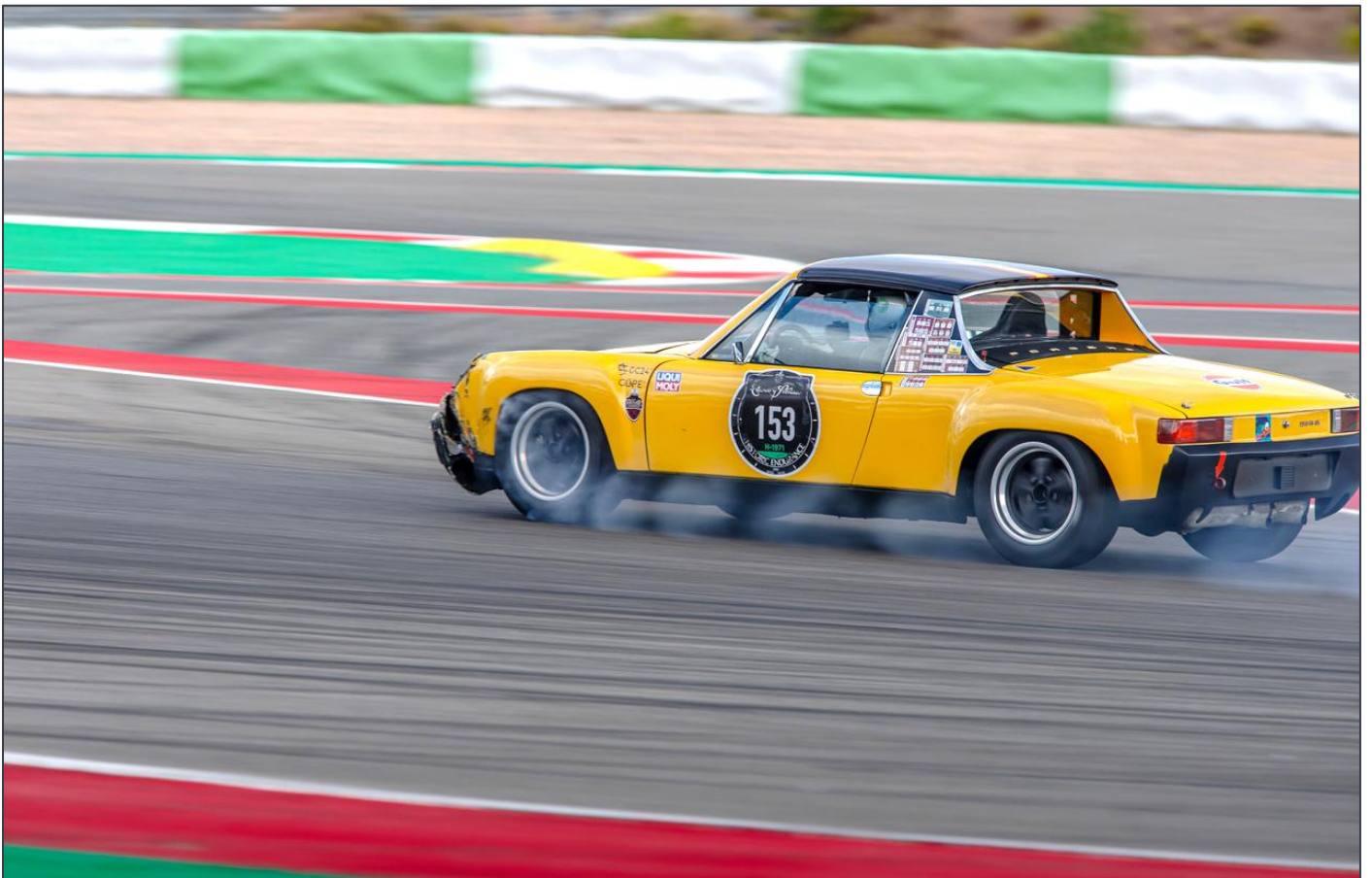
Manuel González de la Torre, siempre competitivo, protagonizó bonitos duelos, con su Porsche 914/6